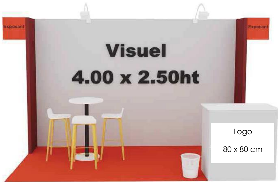
Visuel et mobilier non contractuels