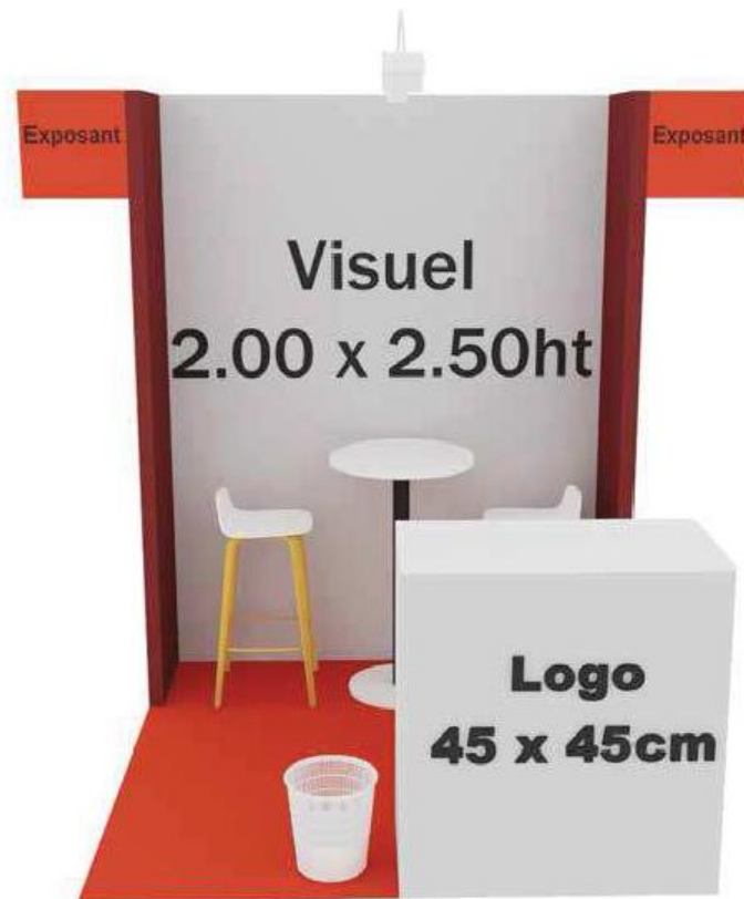
Visuel et mobilier non contractuels